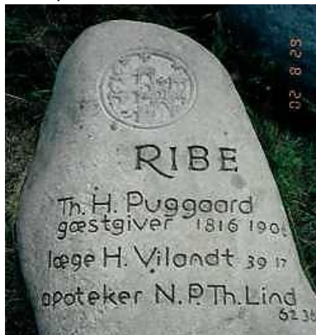
Mindesten i Kongenshus Mindepark