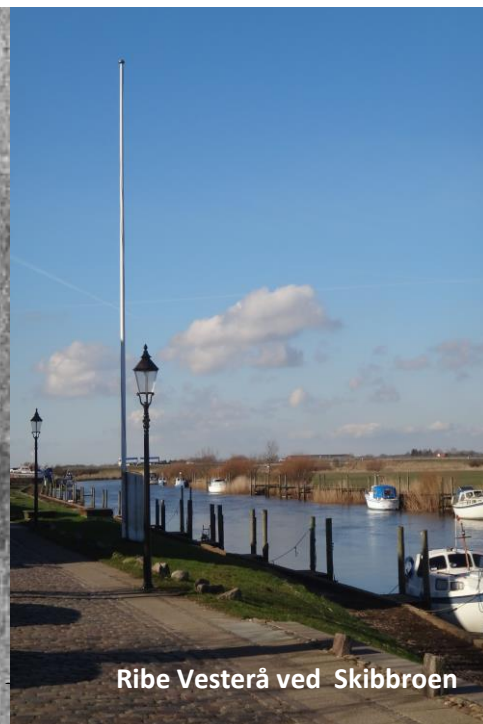
Ribe Vesterå ved Skibbroen